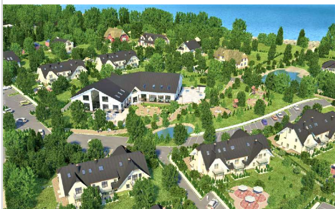
Ansicht Oben 2