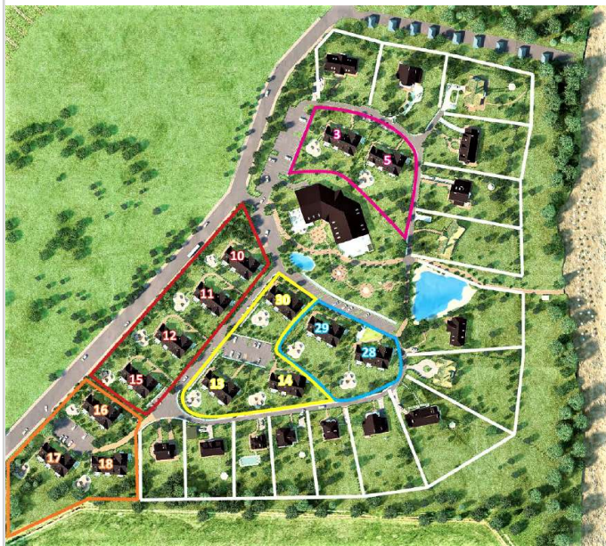
Aufteilungsplan der Häuser 10